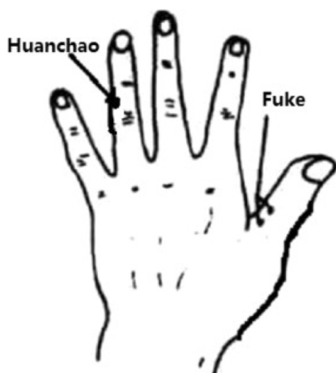
Fig. 1 – Localización de los acupuntos Tung de la mano.